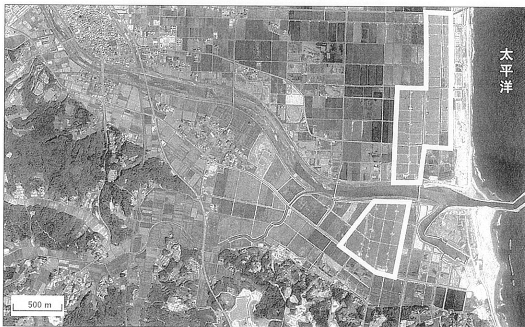
現在の衛星写真(地理院最新写真)